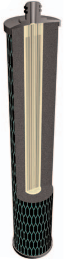
Schnitt durch ein AMF-Filter: Aktivkohleblock mit innenliegenden Kapillarmembranen

Auch als Bakterienfilter zwischen Wasserhahn und Permeattank in Einbau-Umkehrosmoseanlagen lässt sich der AMF-Filter optimal einsetzen.