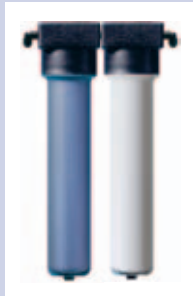
- Inklusive praktischem Wandhalter! -