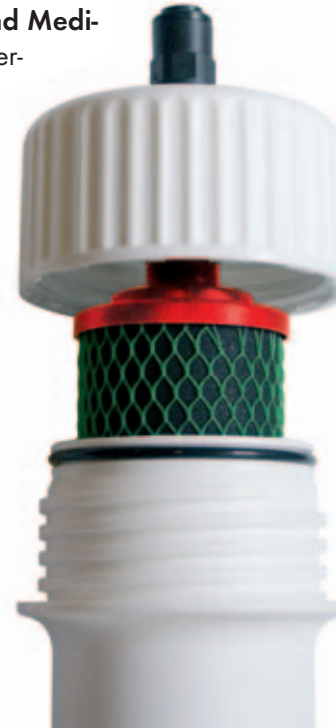
KF-Filter im schlanke POU-Gehäuse mit rundem Kopf (nur \varnothing 75 \text{ mm} )