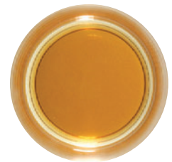
Mit Bellima®: kein Film, keine Trübung, kein Nachbittern, bestmögliches Aroma

2) Optimierung von kaltem Trinkwasser: Papierfächer in max. 1 Liter Trinkwasser hängen und kurz umrühren. Mindestens 30 Minuten einwirken lassen, dabei nach Möglichkeit mehrmals umrühren.