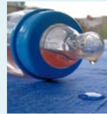
Bisphenol A-haltige Babyflaschen sind gesundheitlich bedenklich

bereits Bisphenol A-haltige Babyflaschen und andere Produkte für Kinder verboten. Flasbarth: »Aus Sicht des Umweltbundesamtes bestehen zwar noch Datenlücken; doch die vorliegenden Kenntnisse sollten ausreichen, die Verwendung bestimmter Bisphenol A-haltiger Produkte aus Vorsorgegründen zu beschränken.« Das UBA empfiehlt den Herstellern, Importeuren und Verwendern von Bisphenol A bereits heute, Verwendungen, die Mensch und Umwelt belasten, durch gesundheits- und umweltfreundliche Alternativen zu ersetzen – als Beitrag zum vorsorglichen Schutz von Mensch und Umwelt.