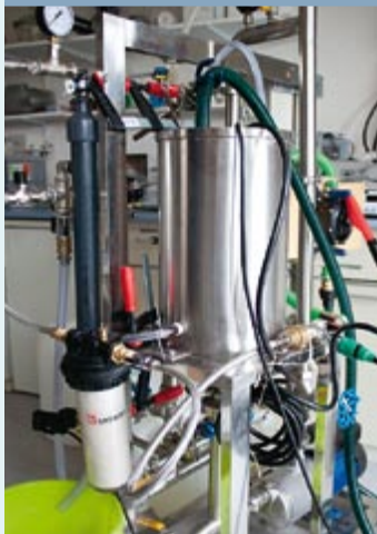
Der hoch effiziente Prototyp des neuen Wasseraufbereitungsmoduls

Zusammen mit der Konstanzer Membrane Engineering GmbH und der Steinbeis Stiftung hat Carbonit eine handbetriebene Wasseraufbereitung für Krisengebiete entwickelt. Wie auch beim bewährten Krisenfass besteht das Herzstück aus MF-Hohlfasermembranen und einer anschließenden Filtration mittels gesinterter Aktivkohle-Blockfilter. Durch eine optionale Vorfiltration ist gewährleistet, dass das System auch bei Oberflächenwässern mit hoher Trübung und längerer Standzeit funktioniert. Entscheidende Vorteile sind die dadurch geringere Gefahr der Verkeimung und der deutlich niedrigere Desinfektionsaufwand. Zum Jahresende wurden mehrere dieser neuen Module nach Ruanda geliefert.