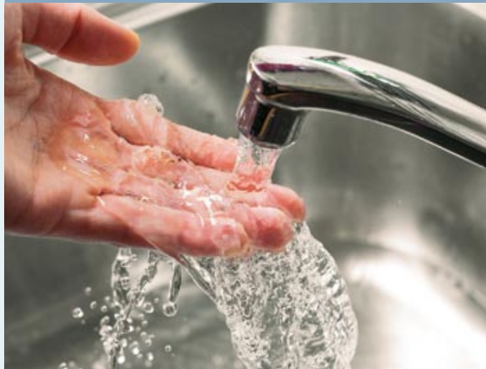
Verband befürchtet höhere Kosten und hygienische Probleme

Die Gestaltung von »wasser & luft« sowie alle darin veröffentlichten Texte, Grafiken und Fotos unterliegen Urheberrechten. Kein Teil dieser Veröffentlichung darf außerhalb der engen Grenzen des Urheberrechts ohne Zustimmung des Herausgebers verwendet werden.