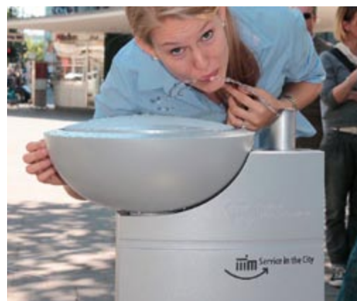
Trinkbrunnen in Berlin vom Designer Marcus Botsch