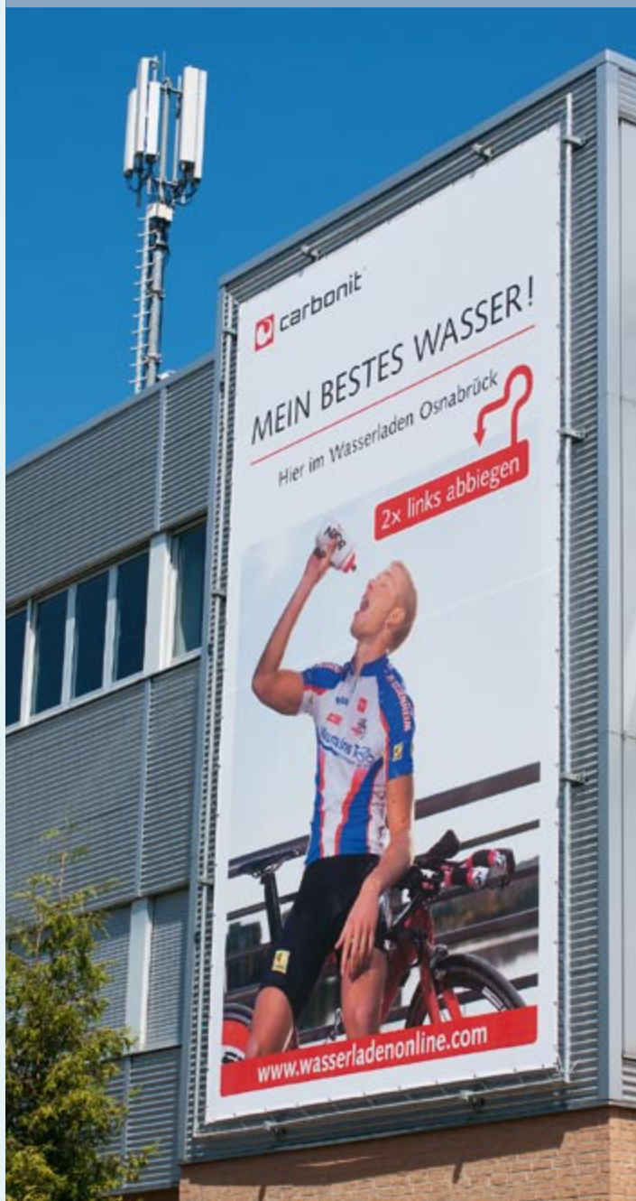
Wirklich nicht zu übersehen: riesiges Werbebanner lockt in den Wasserladen

Mit einem riesigen Werbebanner will der Wasserladen Osnabrück noch mehr Kunden in sein Geschäft locken. Nicht nur die Größe ist dabei wichtig, das Entscheidende ist die Platzierung. So ist das Plakat mit seinen 5,10x8,40 Meter für Kunden eines schwedischen Möbelhauses einfach