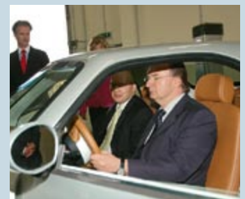
Minister Dr. Haseloff im Elektroauto