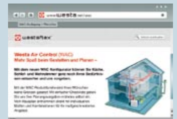
Der WAC Konfigurator im Netz

Immer mehr Bauherren befassen sich neben der Wärmedämmung oder der effizienten Heizung auch mit dem Thema Wohnungslüftung. Genau dafür hat Westaflex den neuen WAC Konfigurator für Komfortlüftung mit Wärmerückgewinnung entwickelt. Das Programm liefert dem interessierten Bauherrn anhand einiger Eckdaten einen Überblick über sein Vorhaben - einschließlich Stücklisten und einer ersten Preisvorstellung. Das funktioniert ganz einfach: Nach der Registrierung werden Angaben zum Projekt erfragt, z. B. Gebäudetyp und Personenzahl. Dann kommen Daten zur Anlage, etwa gewünschter Standort des Zentralgeräts, Art der Luftkanalverlegung oder Ausführung